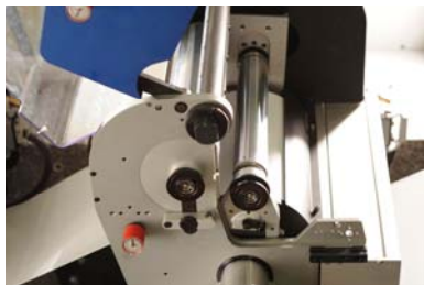
Bild 6: Sehr kurzer Bahnlauf von nur 1.1 Meter zwischen den Druckeinheiten