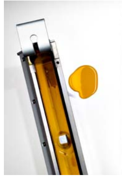
Bild 4: Kammerrakelsystem auf der Gallus ECS 340 für schnelle Farbwechsel