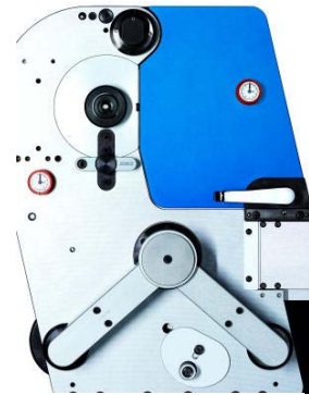
Bild 5: Kompakte Flexodruckeinheit mit gekühltem Geaendruckzylinder