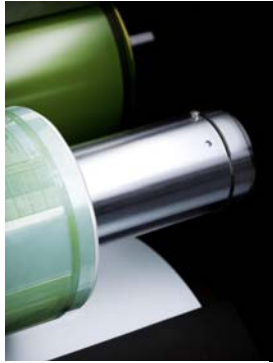
Bild 3: Das Sleeve-System auf der Gallus ECS 340 für schnelle Jobwechsel